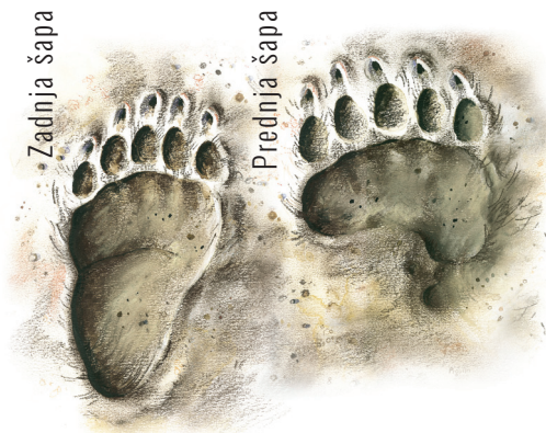
Ilustracija: Igor Pičulin

Ob srečanju z medvedom je najbolj pomembno, da ostanemo mirni in presodimo situacijo. Naslednji koraki se razlikujejo glede na okoliščine srečanja.